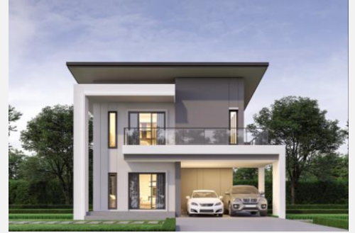
แบบบ้าน Tetris 225