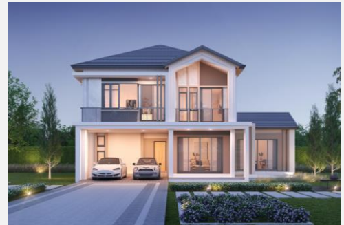
แบบบ้าน THE GRACE 315