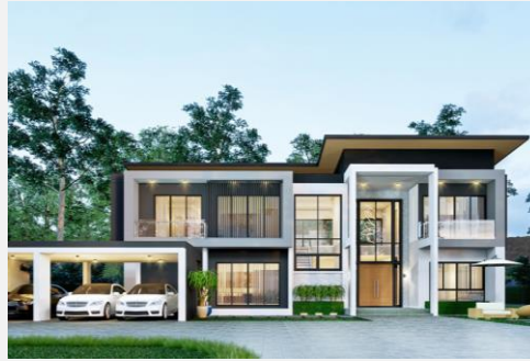
แบบบ้าน INSPIRE 13