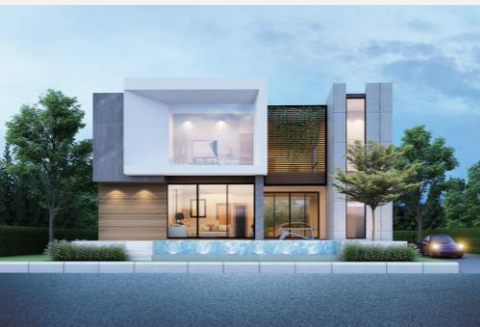
แบบบ้าน RH-MD. 2170