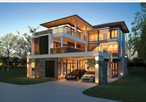
แบบบ้าน Urban 6