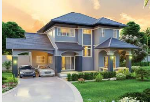
แบบบ้าน รัตนาวดี