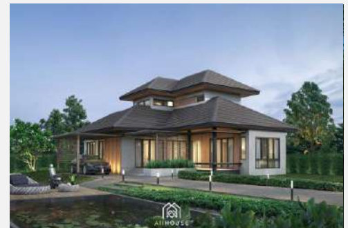
แบบบ้าน SS 151