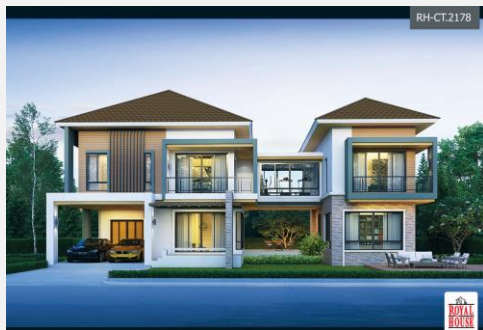
แบบบ้าน RH-CT. 2178