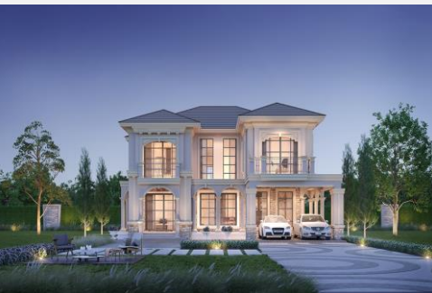
แบบบ้าน THE GRAND 418