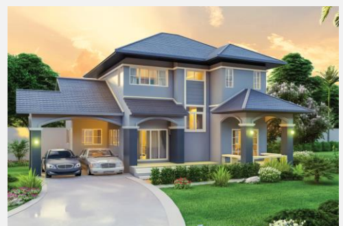
แบบบ้าน รัตนาวดี