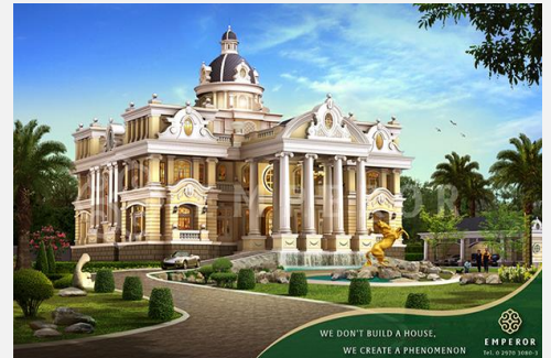
แบบบ้าน Palacio de la Polar