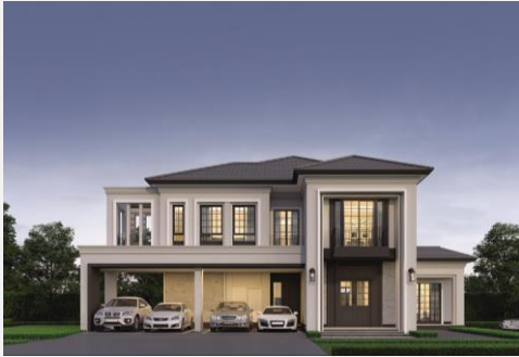
แบบบ้าน Modern English 441

10 แบบบ้านสวย บรรยากาศอบอุ่น ออกแบบเพื่อความสุขของครอบครัวใหม่