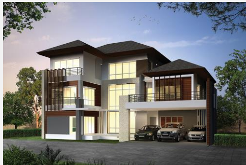
แบบบ้าน The Master 3