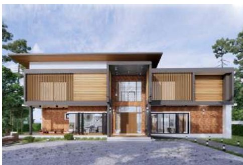
แบบบ้าน ABSOLUTE 09