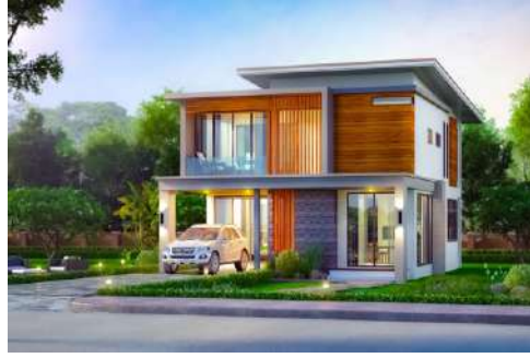
แบบบ้าน กชพรรณ