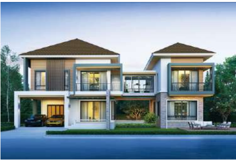
แบบบ้าน RH-CT. 2178