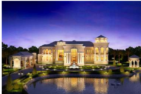
แบบบ้าน The Valencia 02