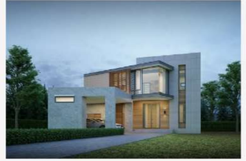
แบบบ้าน RH-MD. 2168