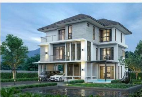
แบบบ้าน SS 304