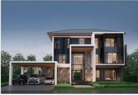
แบบบ้าน The Fame 658

เหมาะกับการสร้างบ้านคุณภาพสำหรับครอบครัว