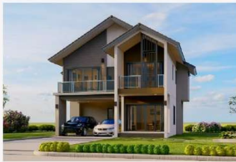
แบบบ้าน พิมพีวีไลลักษณ์