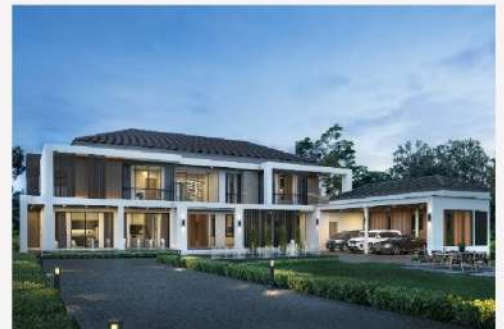
แบบบ้าน Beverly Hills