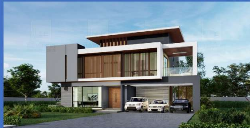
Modern Style M0-07