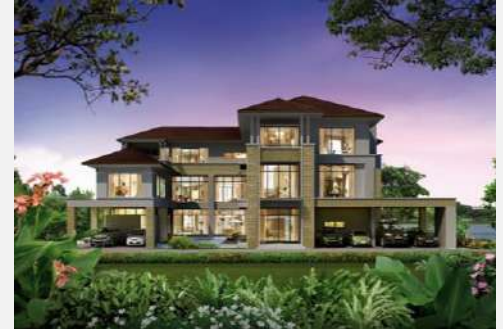
แบบบ้าน The Pride