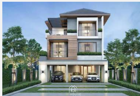
แบบบ้าน SS 302