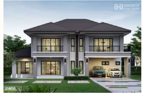
แบบบ้าน ราชดำริ