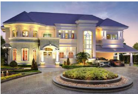
แบบบ้าน NEO-CLASSIC 02