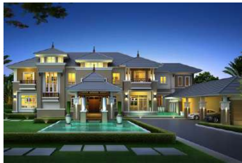
แบบบ้าน The Precious