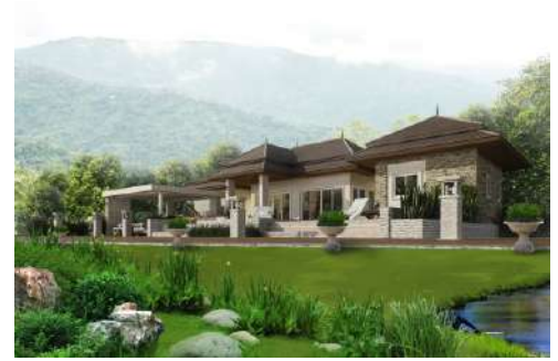
แบบบ้าน อิงฟ้า