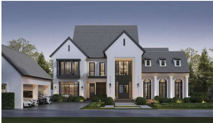
แบบ Thames 777